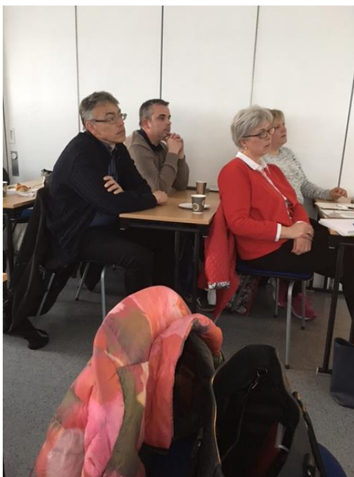
Konsentrerte medlemmer følger ivrig med.

Diskusjonen gikk livlig i NKKs lokaler på Bryn, men som en oppsummering kan vi si at den beste anbefalingen innleder og debattantene ga, var at klubben må få laget en undersøkelse for å finne ut av dette med bakgrunn i faktiske opplysninger fra våre oppdrettere. NWCK må forsøke å få til et samarbeidsprosjekt med Norges miljø- og biovitenskapelige universitet, NMBU, samt helseavdelingen i Norsk Kennel Klub. Det hadde vært supert om en av studentene ved NMBU kunne utføre dette som for eksempel en masteroppgave